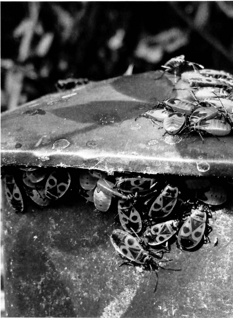
Diese Feuerwanzen, fotografiert von Julieta Aranda, erinnern die Künstlerin an Kriegsbemalung