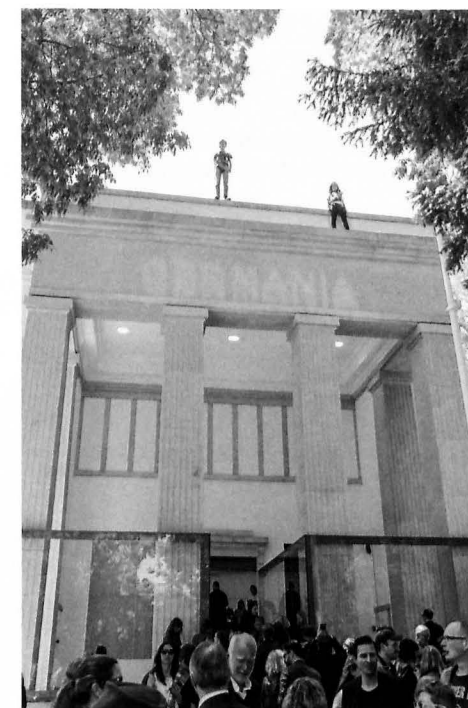
Pavillon Deutschland mit der Arbeit Faust von Anne Imhof

Ägypten 328 Nordischer Pavillon 296 Australien 314 Österreich 322 Belgien 284 Polen 330 Brasilien 318 Rumänien 332 Dänemark 300 Schweiz 278 Deutschland 230 Serbien 326 Finnland 293 Spanien 290 Frankreich 250 Tschechische Republik 312 Griechenland 336 Russland 258 Großbritannien 246 Ungarn 304 Israel 308 Uruguay 306 Japan 269 USA 272 Kanada 254 Venezuela 282 Korea 264 Niederlande 286