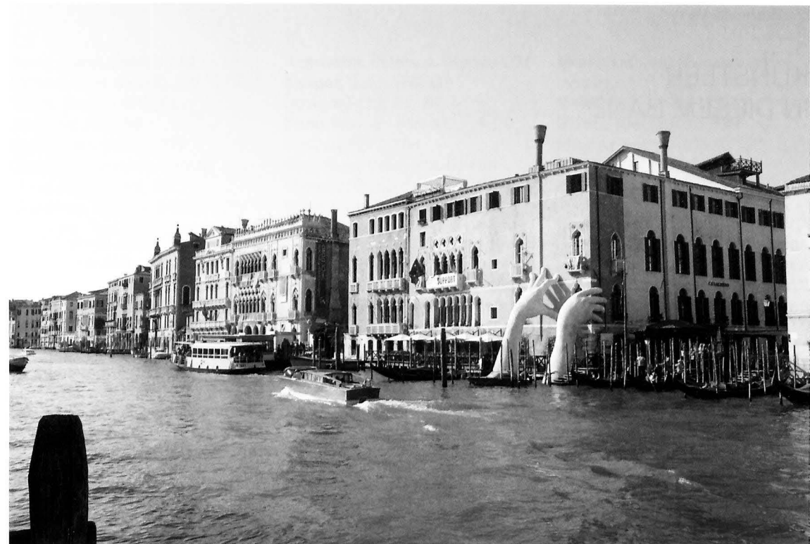
Lorenzo Quinn, Support , Venedig 2017, Courtesy der Künstler. Foto: M.A. Tappeiner