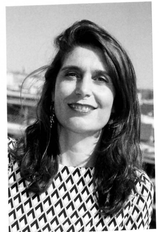
Christine Macel, Kuratorin der 57. Biennale Venedig